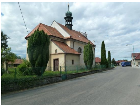
Kostel sv. Jiljí

Na území obce je evidován objekt zapsaný ve státním seznamu nemovitých kulturních památek: