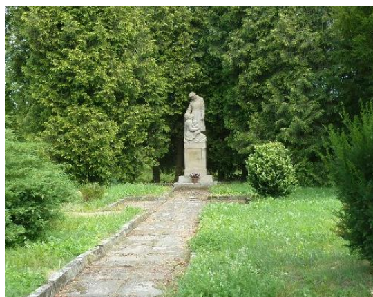
Pomník obětem I.sv.

Řešené území je územím s archeologickými nálezy (ÚAN) podle památkového zákona. Má-li se provádět stavební činnost na území s archeologickými nálezy, jsou stavebníci již od doby přípravy stavby povinni tento záměr oznámit Archeologickému ústavu a umožnit jemu nebo oprávněné organizaci provést na dotčeném území záchranný archeologický výzkum. O archeologickém nálezu, který nebyl učiněn při provádění archeologických výzkumů, musí být učiněno oznámení Archeologickému ústavu nebo nejbližšímu muzeu buď přímo, nebo prostřednictvím obce, v jejímž územním obvodu k archeologickému nálezu došlo.